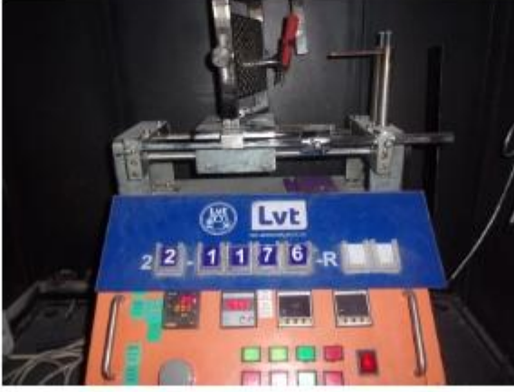
Kızaran Tel Deneyi (Md. 9.1)