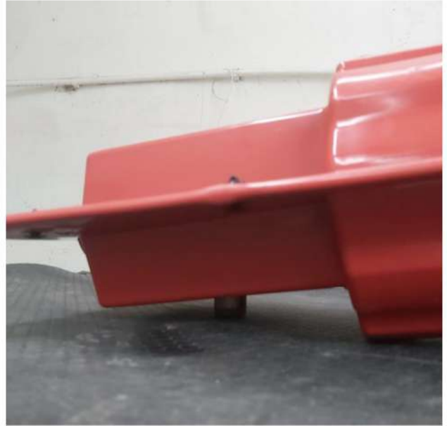
Şebeke Frekanslı Dayanım Testi (Md. 9.1.1)